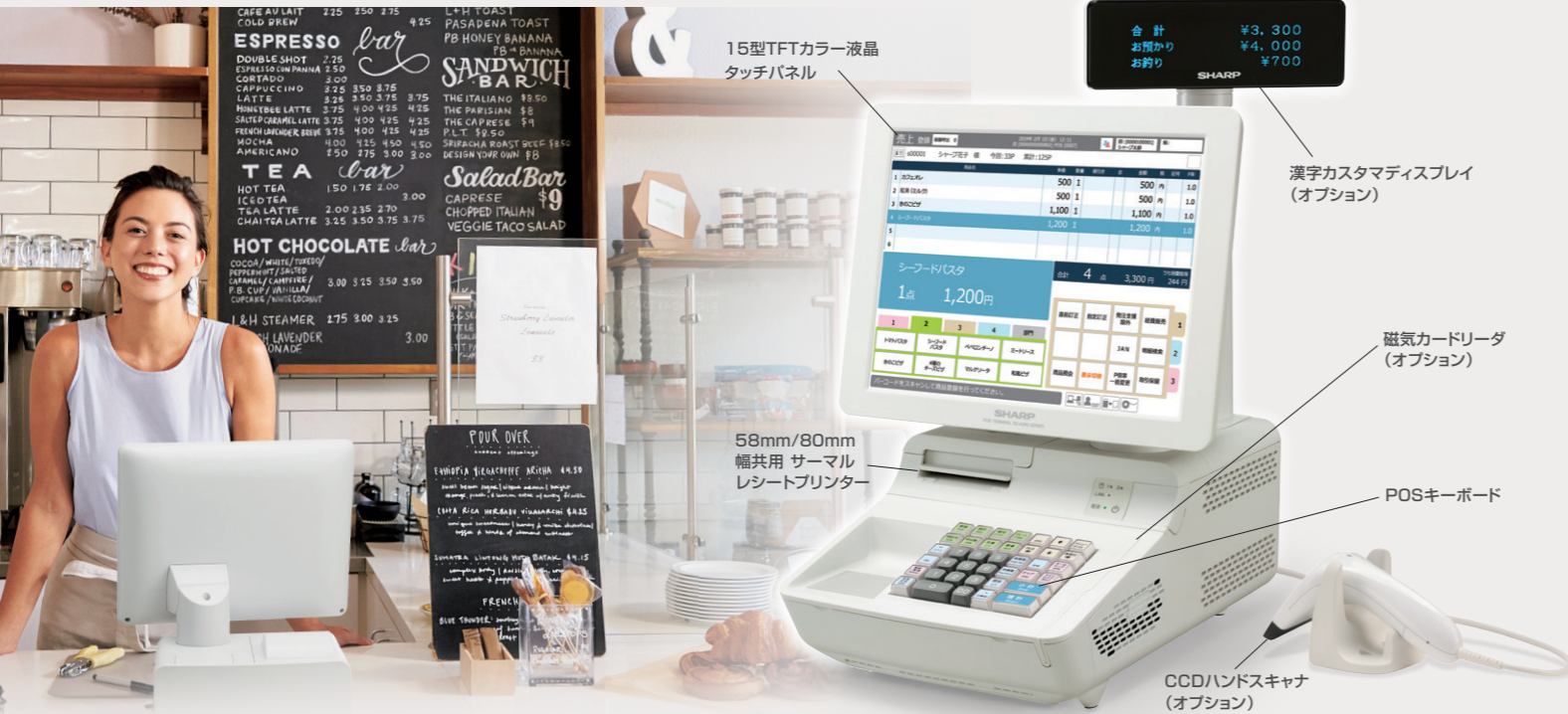
15型TFTカラー液晶 タッチパネル