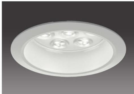
150形 / 透明パネル(表面シボ加工)