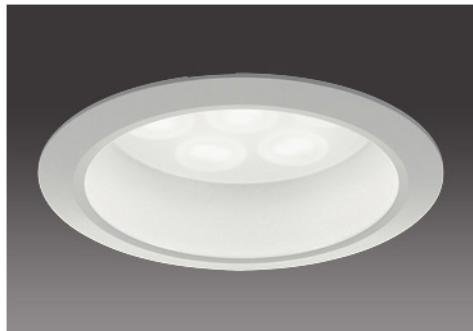
100形 / 半透明パネル