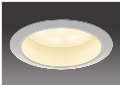
100形 / 半透明パネル