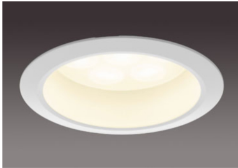
100形 / 半透明パネル