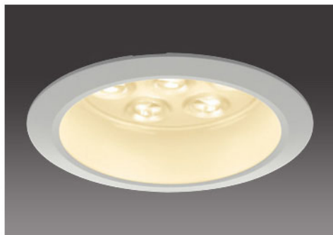
100形 / 透明パネル(表面シボ加工)