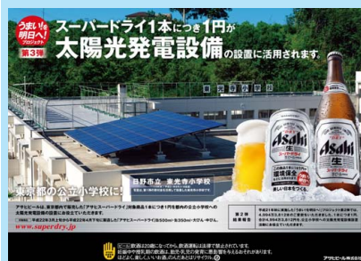
アサヒスーパードライ 『うまい!を明日へ!』 プロジェクト

例えば、北海道ではラムサール条約登録湿地の保全、滋賀県では琵琶湖の保全、京都府では文化財の保全活動など、地域の皆さまに喜んでいただける活動を、自治体や地元NPOと連携して行っています。この点が高く評価され、第19回「地球環境大賞」において「地球環境会議が選ぶ優秀企業賞」を受賞しました。