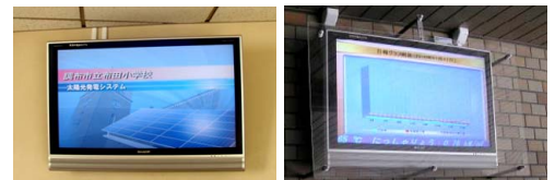
(調布市立布田小学校) (武蔵野市立桜野小学校)