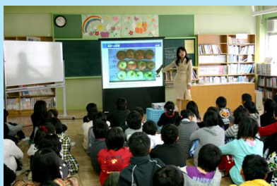
「森と太陽の教室」をシャープと共同で実施中

地球温暖化の話に始まり、森林保全の必要性、太陽光発電の仕組みなど、楽しく授業することで、環境問題や太陽光発電への子どもたちの関心や理解が深まります。省エネ意識を変える大きな原動力にもなり、各校からたいへん好評をいただいております。今後も継続して開催していく予定です。