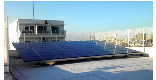
小学校に設置された太陽光発電システム (墨田区立第二寺島小学校)

本プロジェクトは、今後、2011年秋までの実施を予定しており、トータルで21校に設置する予定となっています。これからも少しでも多くの子どもたちの笑顔が見たいですね。