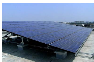
日野市立東光寺小学校さま