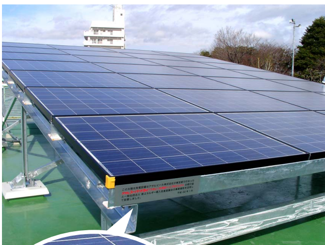
荒川区立第一日暮里小学校さま

自然や環境などの保全・保護活動に、対象商品の売上の一部を活用するアサヒスーパードライ『うまい!を明日へ!』プロジェクトを47都道府県で実施しており、東京都では公立小学校への太陽光発電システムの設置を進めています。