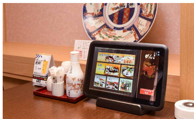
セルフオーダー導入後、夕食時のドリンクなどの追加注文が増加