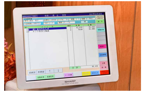
タブレット端末からのオーダーデータをレジのPOSターミナルで管理