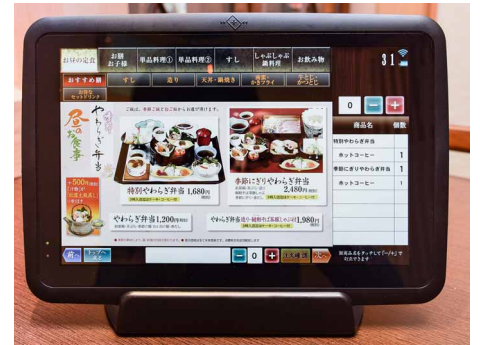
各テーブルに設置したタブレット端末を既存のシャープPOSシステムと連携