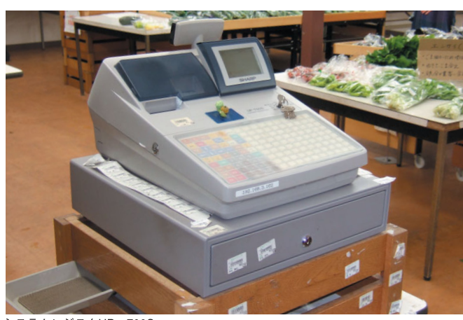
システムレジスタUP-700S