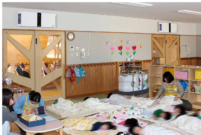
お昼寝を妨げない低騒音設計も好評

冬場に限らずハウスダストやカビ対策などで一年を通じて効果が発揮されることにも期待しています。また現在、行事などで遊戯室に大勢が集まる際には、保育室に設置している床置き型のイオン発生機を一時的に複数台持ち込んで対応していますが、今後はそうした遊戯室をはじめ、トイレ空間などへの追加導入も視野に検討して参ります。