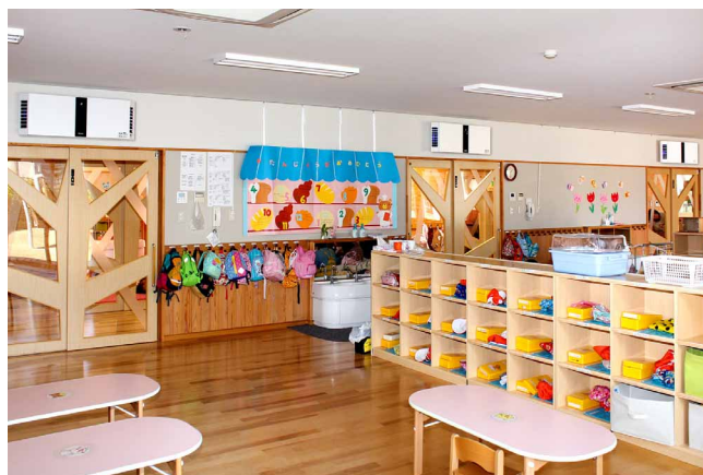
冬場は土日も含め連続運転を続け、クリーンな空気環境を維持