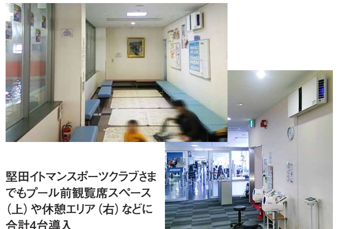
堅田トランススポーツクラブさまでもプール前観覧席スペース(上)や休憩エリア(右)などに合計4台導入