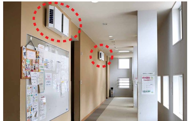
更衣室前の広い廊下の壁に2台設置