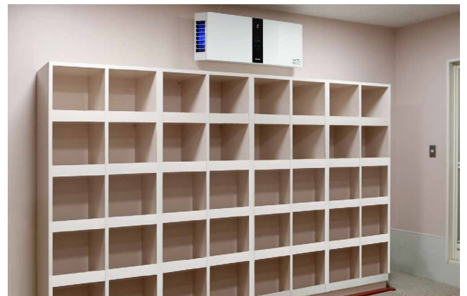
子ども専用の男女更衣室の壁に各1台

3階は各種マシンを揃えたジムとヨガやダンスレッスンのためのスタジオですが、汗のニオイなどを改善したいと考えており、現在、導入を検討中です。また、当クラブに続き系列クラブでも、休憩エリアや保護者がお子さまのレッスンを見守られるプール前観覧席スペースに壁掛け/棚置き兼用型を設置するなど、導入の動きが一層活発化しています。