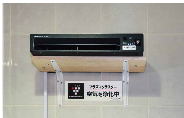
ステッカーでプラズマクラスターの導入をお客さまにPR