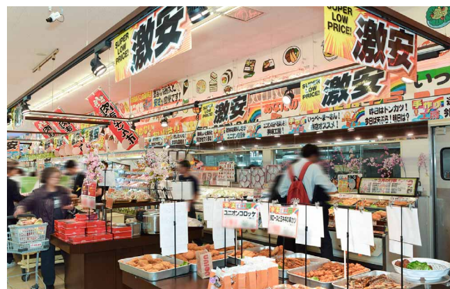
今後導入を検討される惣菜コーナー