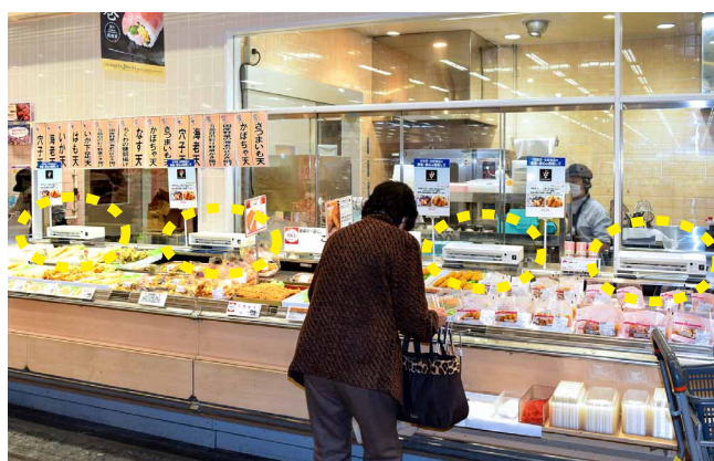
パックをせず陳列している惣菜をエアーカーテンでガード