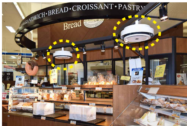
照明の配線を利用して天井吊り下げ型をスムーズに導入

当店での導入効果は大いに満足しており、今後は同じ課題を抱える店舗にも展開していければと考えています。