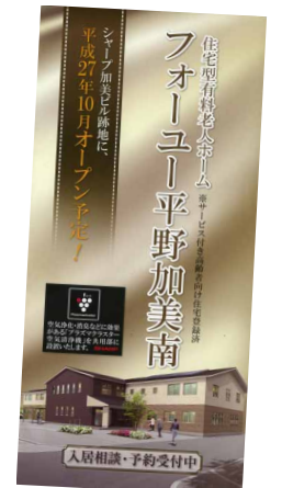
新施設の案内にも活用