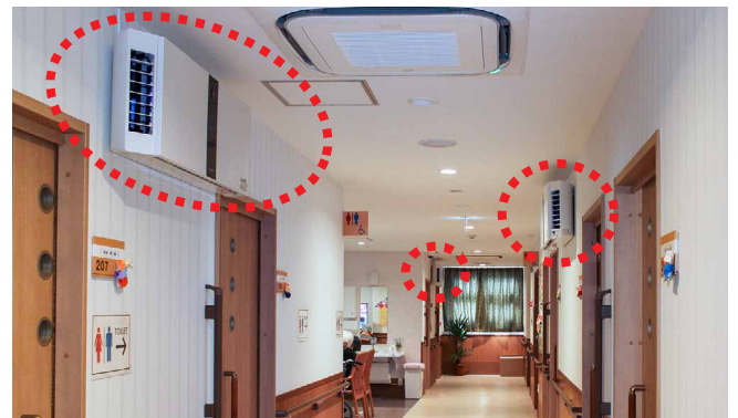
1～3階は廊下に3台、浴室前に1台、食堂に1台の計5台を設置