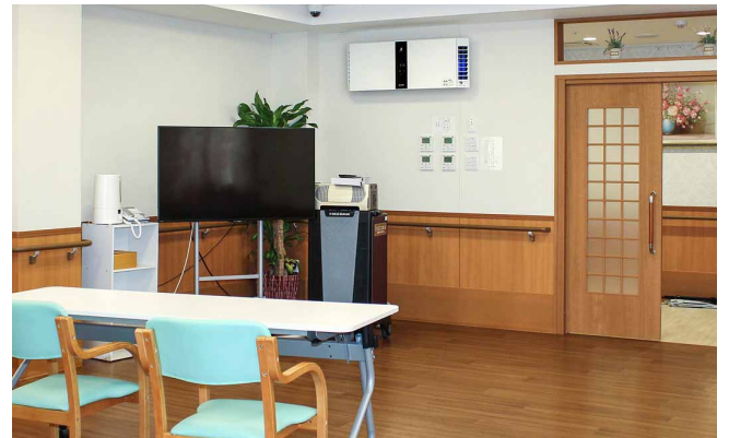
4階の多目的スペースには壁掛け/棚置き兼用型プラズマクラスター空気洗浄機他、50V型AQUOSも

当社では来年の春以降も年間4～5棟のペースで新しい施設を開設予定で、10月オープンの住宅型有料老人ホームへの導入決定に続き、今後も新規物件への採用を検討しています。また、入居者募集広告にプラズマクラスター搭載商品の標準装備を掲載するなど先進性をアピールし、選ばれる介護施設として躍進を目指します。