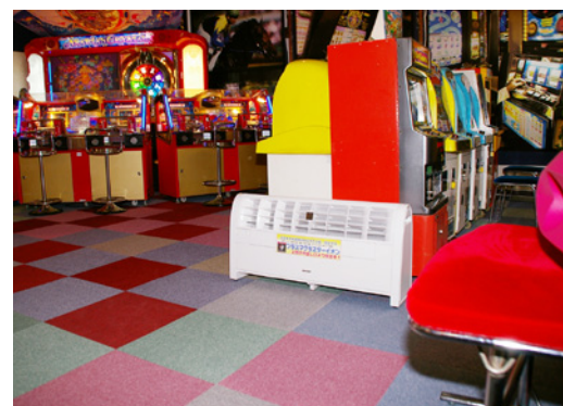
アミューズメント施設にも、くまなく設置