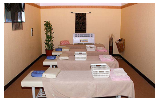
マッサージルームも、ますますリラックスできる空間に