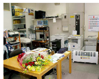
事務所内や社員食堂にも設置