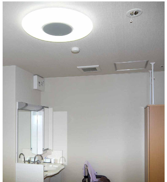
全居室にDL-C201Dを標準装備。部屋中が均一に明るいと好評

現在、2012年度中に完成予定の他施設での増築が決まっており、照明を各入居者に自由に選択していただくことも検討しています。シャープのLEDシーリングライトには、調色機能のついたタイプや、癒し&安眠サポート効果の高いさくら色タイプなど、高齢の方々に喜んでいただけそうな豊富なラインアップがあるので、入居される方へぜひご案内したいと考えています。