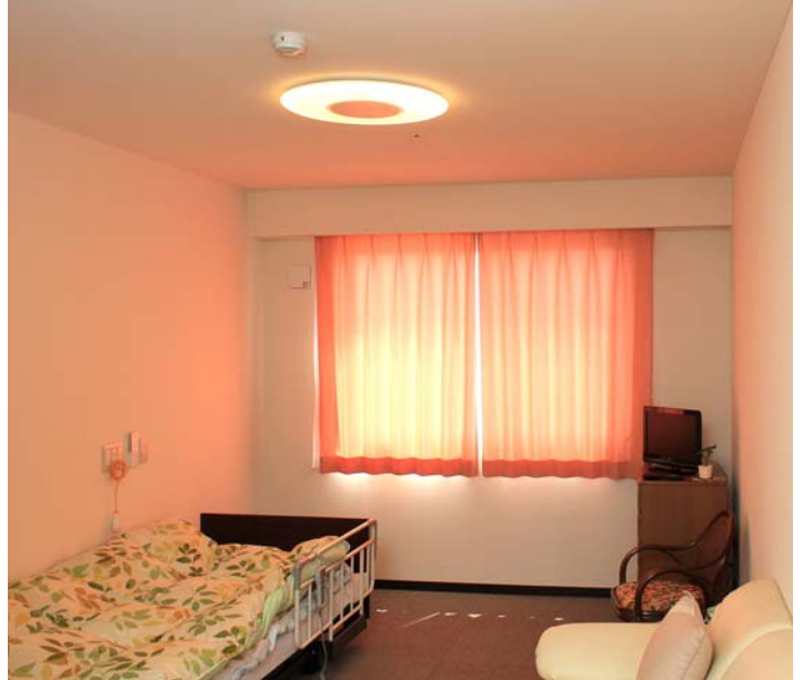
就寝前などは電球色でリラックスタイムを演出