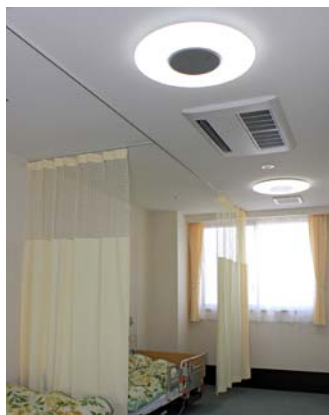
デイサービス用の静養室