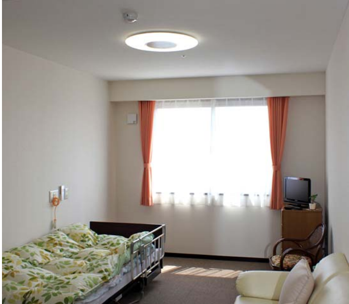
新聞や本を読むときには昼白色で読みやすく