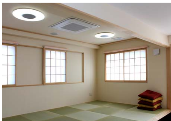
デイサービス等で利用される和室にも似合うデザイン