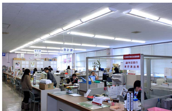
市役所1F。市民窓口も明るくなりたいへん好評

玄関と応接室にはプラズマクラスター搭載タイプを導入、玄関では出入りの際にプラズマクラスターのシャワーを浴びていただいています。また、この地域ではLED照明の導入はまだ少ないので、環境対策に対する市民啓蒙にも役立てたいと考えています。