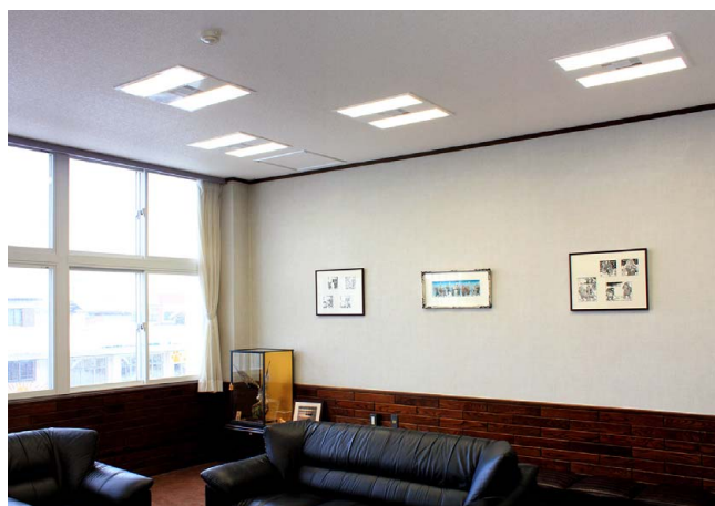
応接室にはプラズマクラスター搭載タイプ