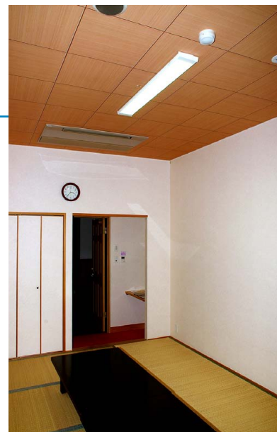
LED照明の導入で課題だった貸室の明るさがアップ

そうした中で、お客さまにゆっくり食事をしていただいたり、くつろいでいただくための貸室もご用意していますが、少し暗いというご意見をいただくことがあり、早急な対応が必要となったのです。