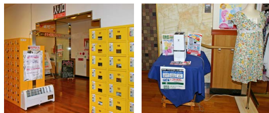
LED照明だけでなく、プラズマクラスターイオン発生機も設置し、お客さまの快適をサポート