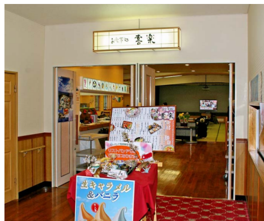
お食事処の行燈にもLED照明を導入

すべてのお客さまにリラックスしていただける快適さと、エネルギーのムダの削減、環境への配慮を今後も一層追求していくつもりです。