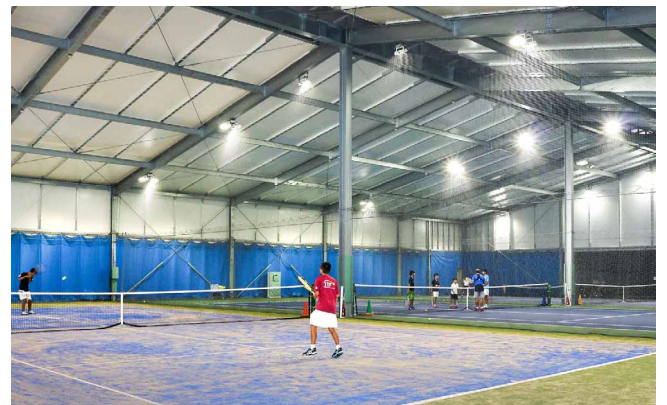
縦36m×横45m、最上部の高さ9.5mの空間に均一で明るいテニスコートが実現

当社では、今後オープンさせるスクールにもLED投光器の採用を考えており、当スクールはモデルケースとして注目を集めています。また、照明以外にも、クラブハウスの快適化にプラズマクラスター空気清浄機を設置したり、スケジュール表示用に液晶ディスプレイを導入することも視野に入れており、設備面でも好感度の高いテニススクールを目指したいと考えています。