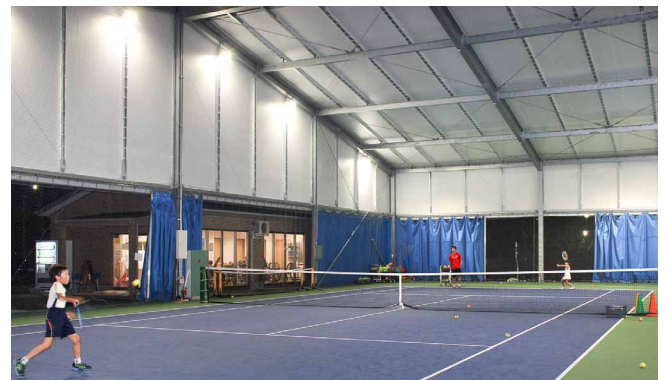
屋外での試合を想定し、カーテンを常時開けていても虫が近寄りにくい