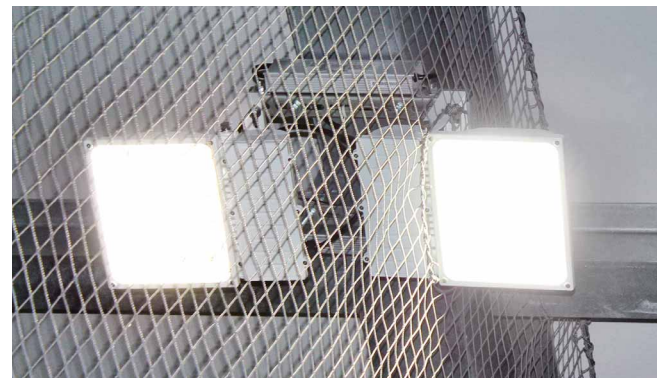
発光面に約10度の傾斜をつけて設置。エリア配光でプレー中のまぶしさを軽減