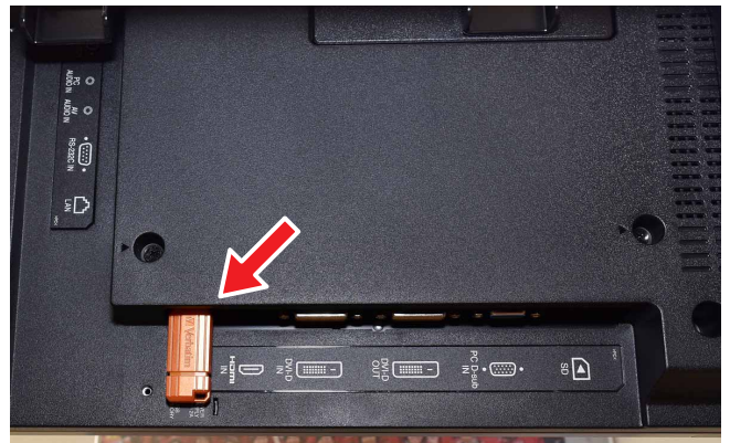
ディスプレイ背面下部に差したUSBメモリー内のコンテンツを表示