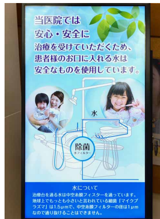
治療の内容や安心して診療を受けられることをPR