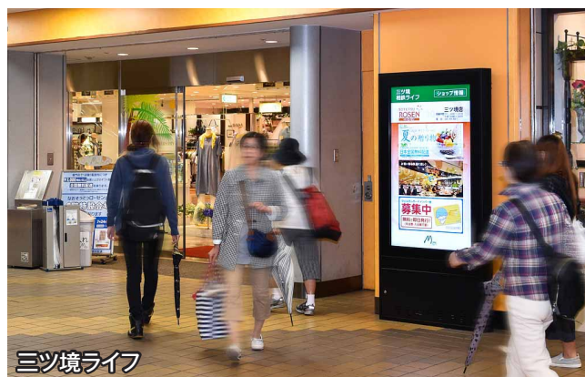
三ツ境ライフ 店舗からの情報を駅利用客に向けて効果的に訴求