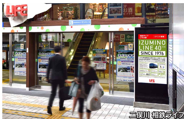
三俣川 相鉄ライフ 高輝度なので、日中の明るい外光の下でも見やすい

現在サイネージでは、相鉄ライフと入居するテナントからの情報を主に発信していますが、今後は近隣の店舗からの広告も幅広く受け入れて、広告料の収入源としても活用したいと考えています。また、鉄道の運行情報や防災情報を表示するなど、ICTを活用した情報発信で地域住民の利便性向上にも役立てていきたいと思っております。