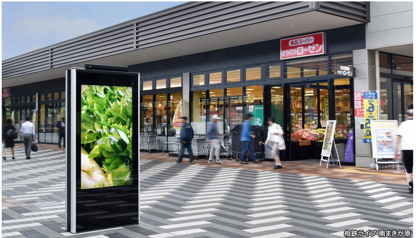
相鉄ライフ 南まきが原