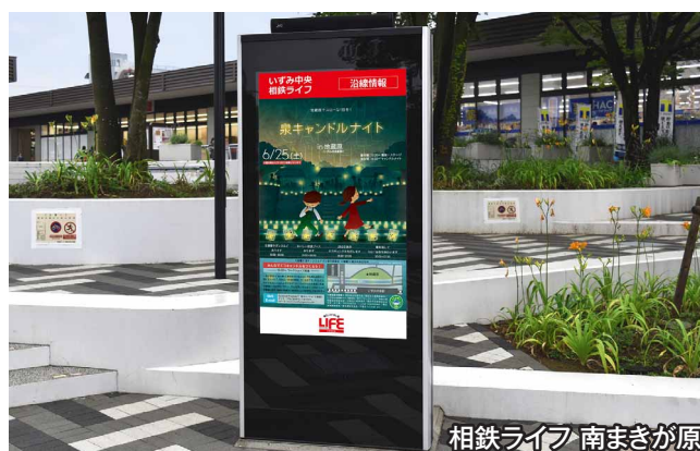
相鉄ライフ 南まきが原 店舗のキャンペーン情報などと合わせて、地域のイベント情報も発信