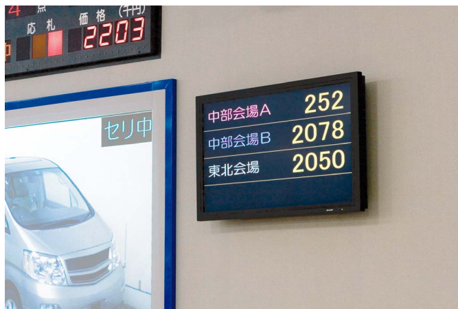
一番下のスペースは東北会場がまもなく2レーンとなるために空けてある。