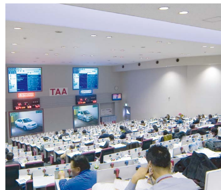
関東会場の中でもいちばん広い本館セリ会場になると、最後列の席から『PN-455』の設置場所までかなりの距離があるが、出品番号がしっかり読み取れる。