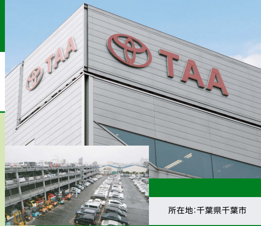
所在地:千葉県千葉市