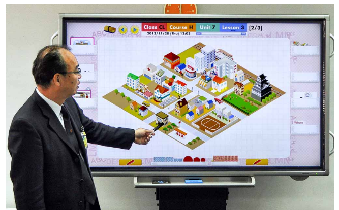
地図上を車や電車が動き、よりリアリティの高い会話力を育む