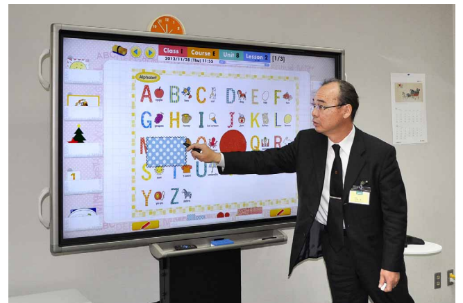
アルファベットのの一部を隠し、クイズ形式で問題を解く

一部の教室にはカメラを設置しており、各地の授業風景を本社会議室に設置した BIG PAD で確認できる環境を構築しています。新人教師の授業をライブで確認し、よりよい指導法をフィードバックすることで、授業のグレードアップを目指します。また今後、タブレット端末も導入予定で、双方向型の授業を実現することで、当社の付加価値向上を図ります。