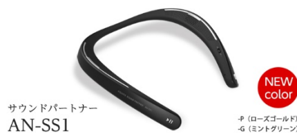
サウンドパートナー AN-SS1

サウンドパートナーに同梱している Bluetooth 送信機を使った接続方法は、下記をご参照ください。