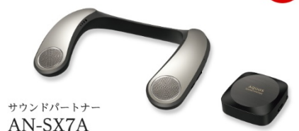
サウンドパートナー AN-SX7A